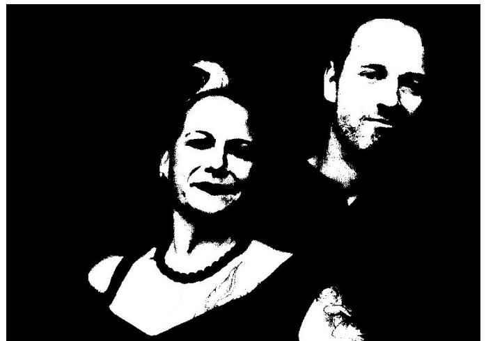
Bereits am Samstagabend stehen Boganza and the Harvest auf der Bühne