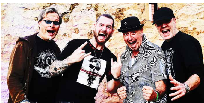
UEFAAA spielt am Sonntag um 18:00 Uhr

Für das ganze Wochenende gilt: Kostenfreie Parkplätze gibt es im Parkhaus in der Lindenstraße. Am Samstagnachmittag kommt es aufgrund des Motorman Run zu Straßensperrungen! Die Umleitungsstrecken sind ausgeschildert.