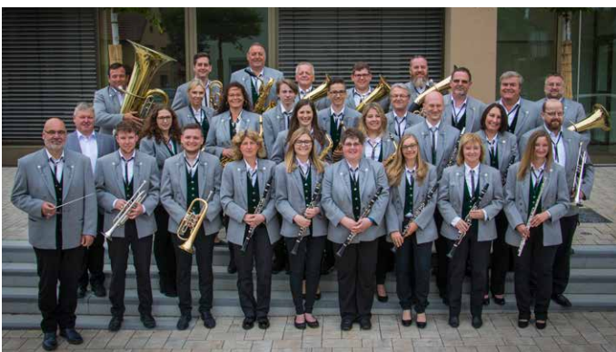
Der Musikverein Kochertürm spielt am Sonntag ab ca. 14:00 Uhr