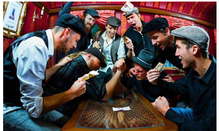
The Distillery Rats